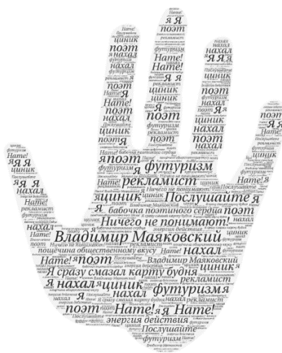
Рисунок 3. Рисунок (облако слов) к уроку «Лирический герой раннего творчества В.В. Маяковского: кто он?»

Так как обучающиеся только начинают знакомиться с творчеством Владимира Маяковского, своеобразием его лирики, авторской позиции, образом лирического героя, целесообразно зафиксировать путь познания. И это может стать схема диаманты, которая создаётся и читается сразу с двух сторон (1 и 7 строка, 2 и 6 строка, 3 и 5 строка, а 4 строка объединяет две темы).