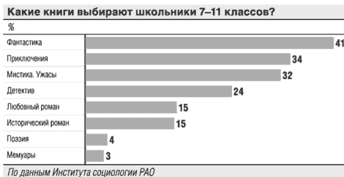
Рисунок 1. Какие книги выбирают школьники 7-11 классов?