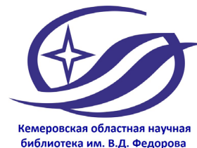
Кемеровская областная научная библиотека им. В.Д. Федорова

Адрес: 650000, г. Кемерово, ул. Дзержинского 19 Телефон: (3842) 44-18-50 E-mail: biblioteka@kemrsl.ru Сайт: https://kemrsl.ru